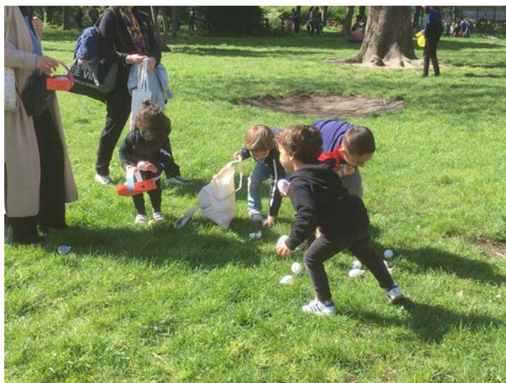
16 avril chasse aux œufs, école Méhul

La distribution de jouets neufs et d'un colis festif en fin d'année permet aux enfants et adultes de vivre les fêtes de Noël dans la dignité.