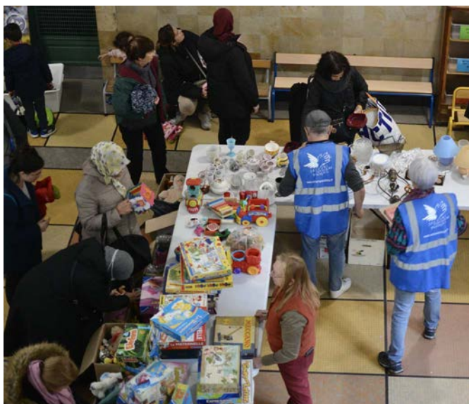
19 novembre braderie brocante, école Méhul