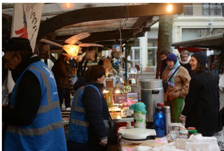
4 décembre marché Église