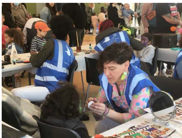
16 avril Chasse aux œufs, école Méhul