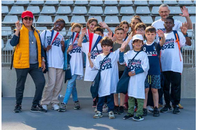
22 juin Journée olympique au Stade Charléty, Paris 13 e