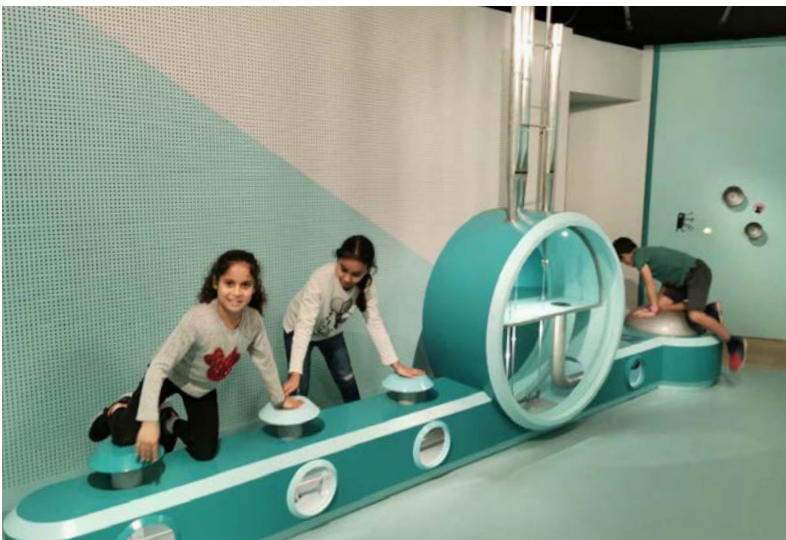
31 octobre Philharmonie des enfants, Paris 19 e