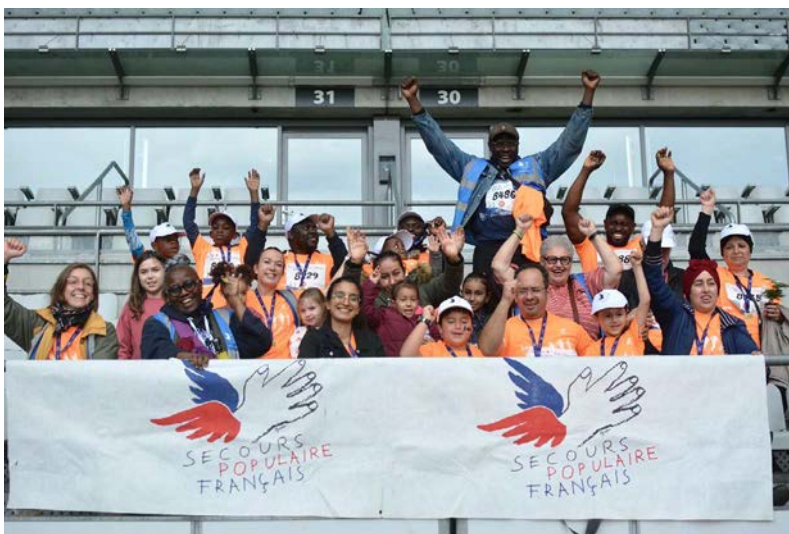
23 octobre La Belle vadrouille, Stade de France