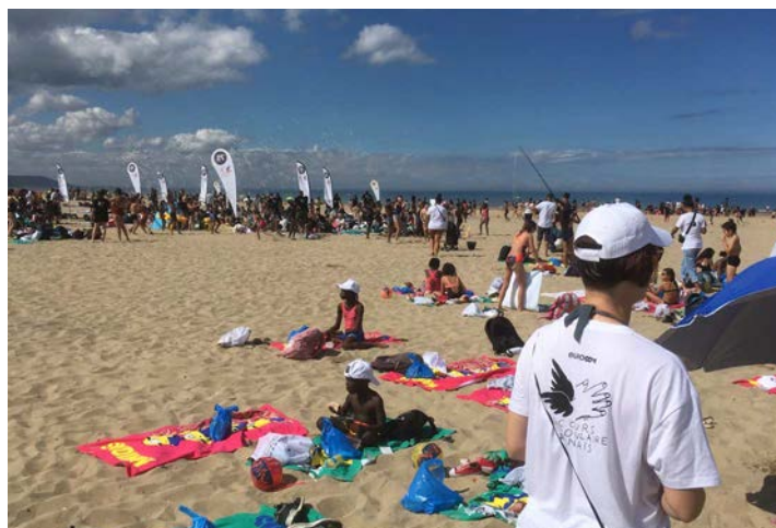
24 août Journée des oubliés des vacances, Deauville