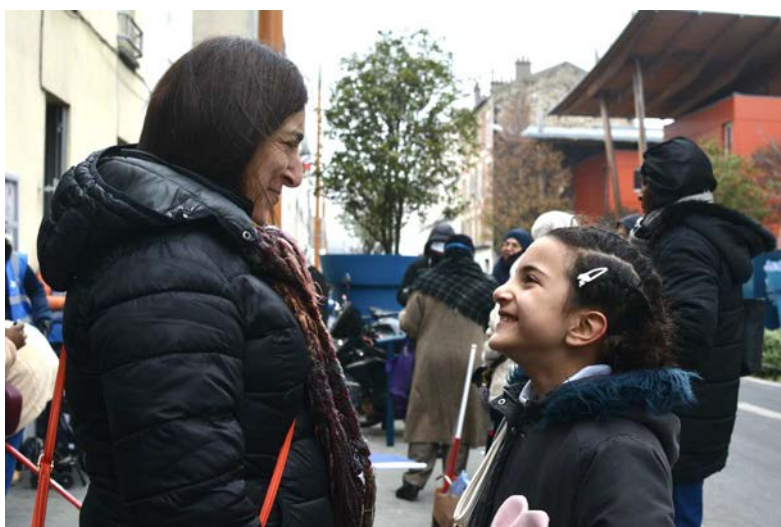
17 décembre rue Denis-Papin

L'équipe anime des réunions d'information sur les droits des travailleurs sans papiers et un atelier « Connaître ses droits à la santé ».