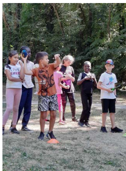
10 août parc de la Poudrerie