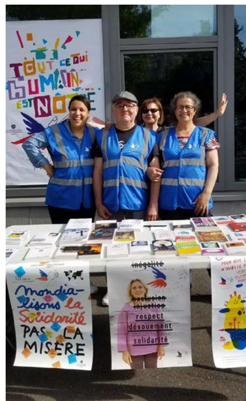
21 mai brocante solidaire, école Saint-Exupéry

2020 : 18 552 heures / 2021 : 21 835 heures