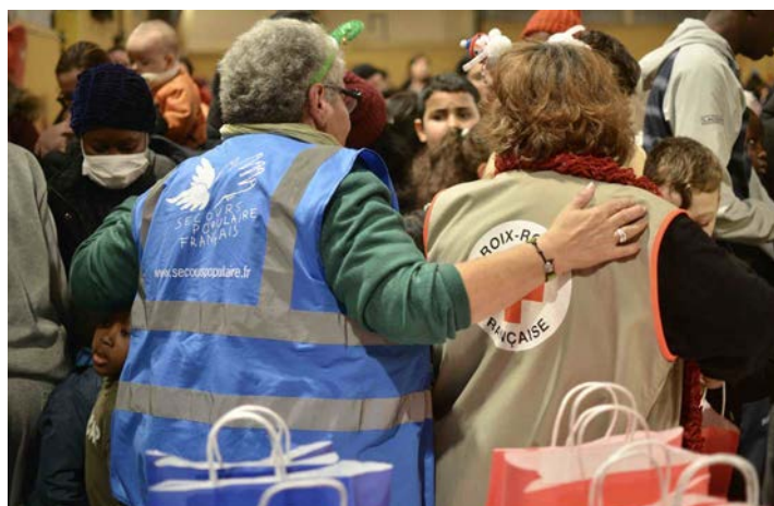
10 décembre Noël solidaire familles, gymnase Léo-Lagrange