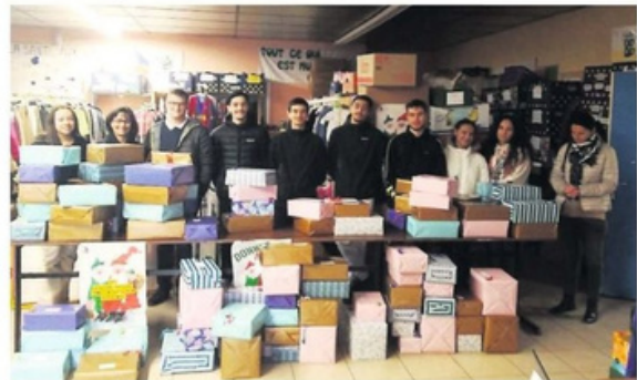
Dans chaque paquet-cadeau, un produit chaud, une douceur, un produit de beauté et un produit culturel.

Ils sont jeunes mais ils n'en oublient pas pour autant les plus démunis. Pour Noël, les lycéens de Clément-de-Pémille se sont mobilisés pour apporter un peu de joie à des bénéficiaires du Secours populaire.