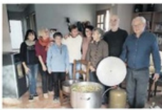
Le repas a été préparé par des bénévoles du comité local.

Il y a quelques jours c'était le réveillon solidaire organisé par le Secours populaire. L'objectif est de rassembler tous les publics en toute simplicité et dans la convivialité et dans la convivialité