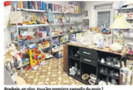
Braderie, en plus, tous les premiers samedis du mois !