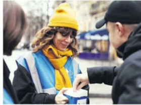
Le Secours Populaire annonce braderies, collectes, spectacle et la biérier

Le Secours Populaire, antenne d'Aussillon, est toujours dans l'action afin de fournir ou de financer ses actions de solidarité. C'est ainsi que samedi prochain 10 février, une braderie exceptionnelle est organisée au local associatif, 31 cours de la Rougerie, derrière la place du marché. De 9 heures à 12 h 30, ce sont des fins de séries en peignures et revêtements de sols qui seront mises en vente. Avec ces bonnes affaires en perspectives pour les bricoleurs on trouvera également des vêtements, des chaussures, de la vaisselle, mais aussi des bijoux, bref, de quoi chiner à son gré et faire des découvertes. Le même jour, les bénévoles du Secours Populaire ouvrent une collecte « spécial hygiène ». Ils seront toute la journée aux supermarchés Auchan et Intermarché d'Aussillon, aidés par les jeunes, tous aussi bé-