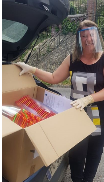
Shields - Visière solidaire