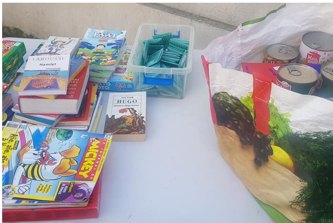
L'aide alimentaire est accompagnée de livres et de produits d'hygiène