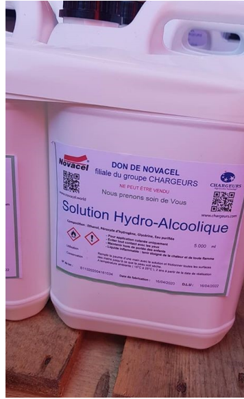
Don de Novacel