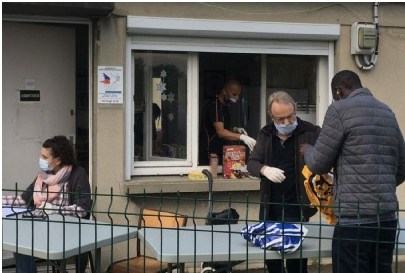
Préparation de l'aide alimentaire par des bénévoles