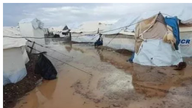
Camp de Karatepe en hiver

premiers secours dispensés par l'association Tolou, le Spf 34 a financé l'achat de 35 de trousse de secours.