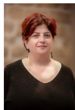
Bahía Amra

« Je crois qu'il n'existe pas de mots pour décrire ce qui se passe à Gaza. Les gens sont épuisés, se font tuer tous les jours, n'ont plus ni eau, ni nourriture, ni électricité. Gaza a tout perdu et a besoin de tout. Ce que je sais, c'est que nous, PMRS, sommes à leurs côtés. Pour la population, la présence d'une infirmière, d'un médecin ou d'un aide-soignant est synonyme d'espoir ; cela veut dire qu'elle n'est pas abandonnée à son sort. C'est la possibilité de se faire soigner, d'avoir parfois des médicaments, mais c'est aussi l'occasion de parler de la violence subie, des conditions inhumaines dans lesquelles elle survit. Les soignants de PMRS sont des héros : ils travaillent sous les bombes, ils ne peuvent peut-être pas arrêter la guerre, mais ils peuvent faire que les gens gardent espoir. En Cisjordanie, la situation s'est beaucoup aggravée. Les équipes de PMRS sont là aussi attaquées, arrêtées. Elles poursuivent leur travail, principalement de manière mobile, en particulier dans la zone C et à Jérusalem-Est. Nous avons besoin d'avoir à nos côtés des partenaires comme le Secours populaire, pour qui les droits humains et les vies humaines prévalent, et qui nous donnent les moyens immédiats d'agir pour prodiguer l'accès aux soins de la population. PMRS, avec ses 400 employés, est la plus grande ONG médicale palestinienne. » Bahía Amra, directrice des programmes et des relations extérieures de PMRS