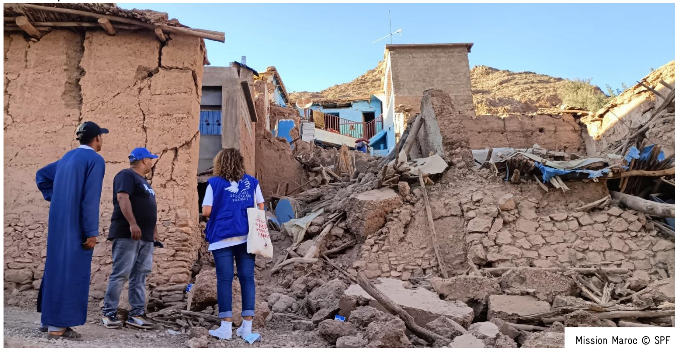
Mission Maroc

Le Secours populaire, qui soutient plusieurs associations marocaines, a depuis le séisme apporté une solidarité dès les premiers jours qui ont suivi la catastrophe et poursuit son action : distributions de biens de première nécessité, mise à l'abri, mise à disposition de matériaux de construction à des familles sinistrées identifiées conjointement avec les autorités locales dans des zones non-bénéficiaires de l'aide de l'Etat, soutien psychosocial à destination des enfants et caravanes socio-médicales pour accompagner des femmes victimes de violences, mais aussi reconstruction de salles de classe et toilettes dans des écoles.