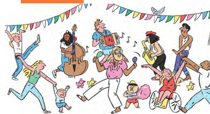
Illustration : © Gwendal Lebec / SPF