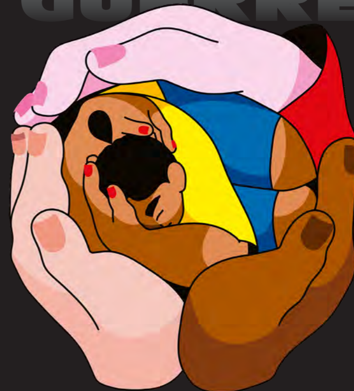
Illustration : © Xaviera Altena / SPF

Les ténèbres de la guerre et des conflits armés ont toujours été là. Du besoin vital d'apporter la lumière dans cette noirceur est née la solidarité du Secours populaire. L'association ne s'appelle pas encore ainsi que ses militants, dès la fin des années 20, prennent la défense des réfugiés persécutés par les régimes oppresseurs en Europe. Durant la guerre d'Espagne, le Secours populaire de France et des colonies soutient sans relâche les combattants et civils républicains jusqu'à l'épisode de la Retirada à l'hiver 1939, où ils furent des centaines de milliers à fuir les troupes