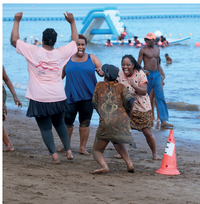
◀ Initiative de Kaweni Nouvelle Aire

Interrompue faute de financement, cette action emblématique de KNA a pu reprendre avec l'appui du Secours populaire. Un premier « Dimanche en famille à la plage » a ainsi rassemblé plus de 200 personnes, enfants, jeunes et parents, le dimanche 28 septembre sur la plage de Bandré. De prochaines éditions de l'événement auront lieu en 2026.