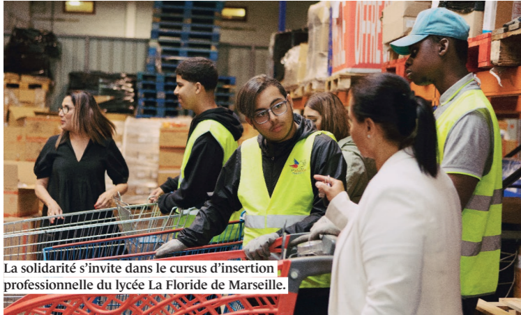
La solidarité s'invite dans le cursus d'insertion professionnelle du lycée La Floride de Marseille.