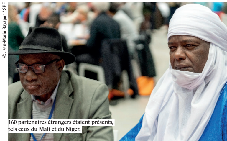
160 partenaires étrangers étaient présents, tels ceux du Mali et du Niger.

>> À ces ateliers ont succédé deux temps forts : les cafés populaires ainsi qu'un rendez-vous consacré au recueil de témoignages de bénévoles intitulé « Raconte-moi ton engagement ». Initiés depuis plusieurs congrès, les cafés populaires ont pour objectif de transmettre et partager les savoir-faire et les bonnes pratiques au sein du mouvement. Quelques exemples : son opération « La Pelle aux artistes » en soutien à l'Ukraine exposée par la fédération du Gard, la présentation par le comité de Saint-Jean-de-la-Ruelle (Loiret) de ses nombreuses actions en faveur de l'accès au sport.