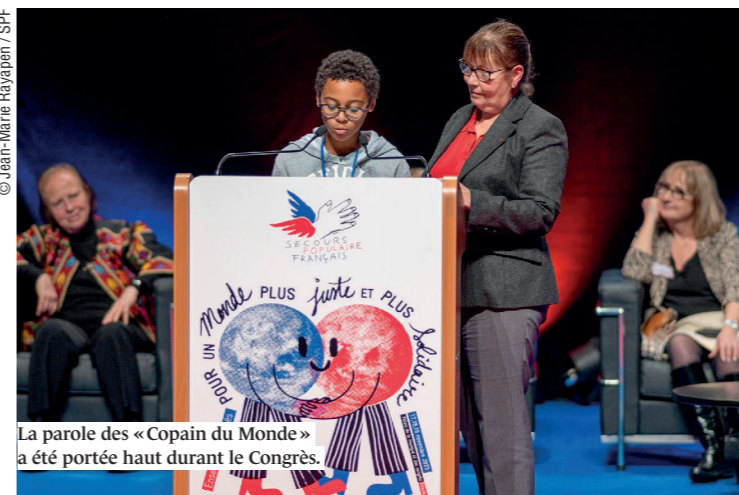
La parole des « Copain du Monde » a été portée haut durant le Congrès.

◆ Après la tenue de centaines d'assemblées générales des comités et congrès des fédérations, le 39 e Congrès national du Secours populaire s'est tenu à Strasbourg du 17 au 19 novembre dernier. Durant trois jours, 1 000 délégués, invités, partenaires étrangers et enfants « Copain du Monde » ont partagé leurs expériences et réfléchi ensemble sur le thème « Ensemble, engagés pour un monde plus juste et plus solidaire ».