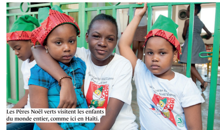
Les Pères Noël verts visitent les enfants du monde entier, comme ici en Haïti.