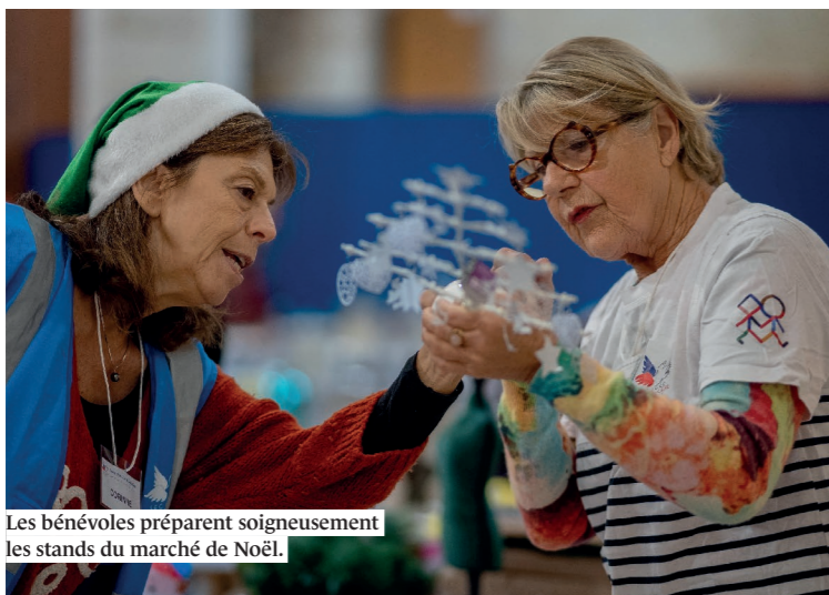
Les bénévoles préparent soigneusement les stands du marché de Noël.