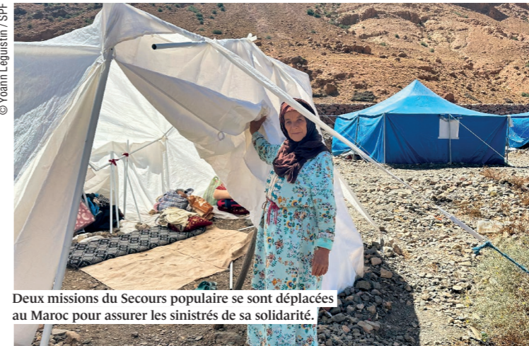
Deux missions du Secours populaire se sont déplacées au Maroc pour assurer les sinistrés de sa solidarité.

◆ La Terre ne cesse de trembler et ses secousses furent récemment meurtrières. Tectonique des plaques ou guerres humaines : quelles qu'en soient les causes, le Secours populaire vient en aide aux victimes en soutenant son réseau de partenaires locaux.