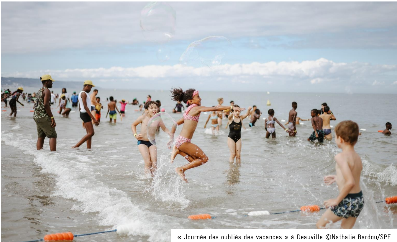
« Journée des oubliés des vacances » à Deauville