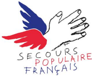
Illustration : Jean-Julien