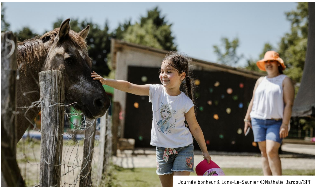
Journée bonheur à Lons-Le-Saunier

L'association fait appel à tous les gens de cœur. A titre d'exemple, un don de 50€, soit 12,50€ après réduction d'impôt, offre une « journée de vacances » à un enfant. Les personnes désirant soutenir les initiatives du Secours populaire peuvent devenir bénévoles ou adresser un don financier au comité ou à la fédération la plus proche : www.secourspopulaire.fr