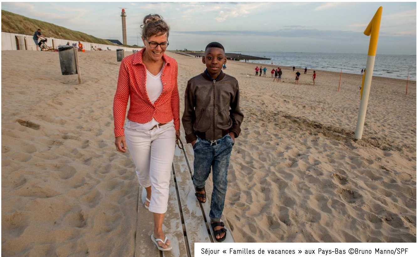
Séjour « Familles de vacances » aux Pays-Bas