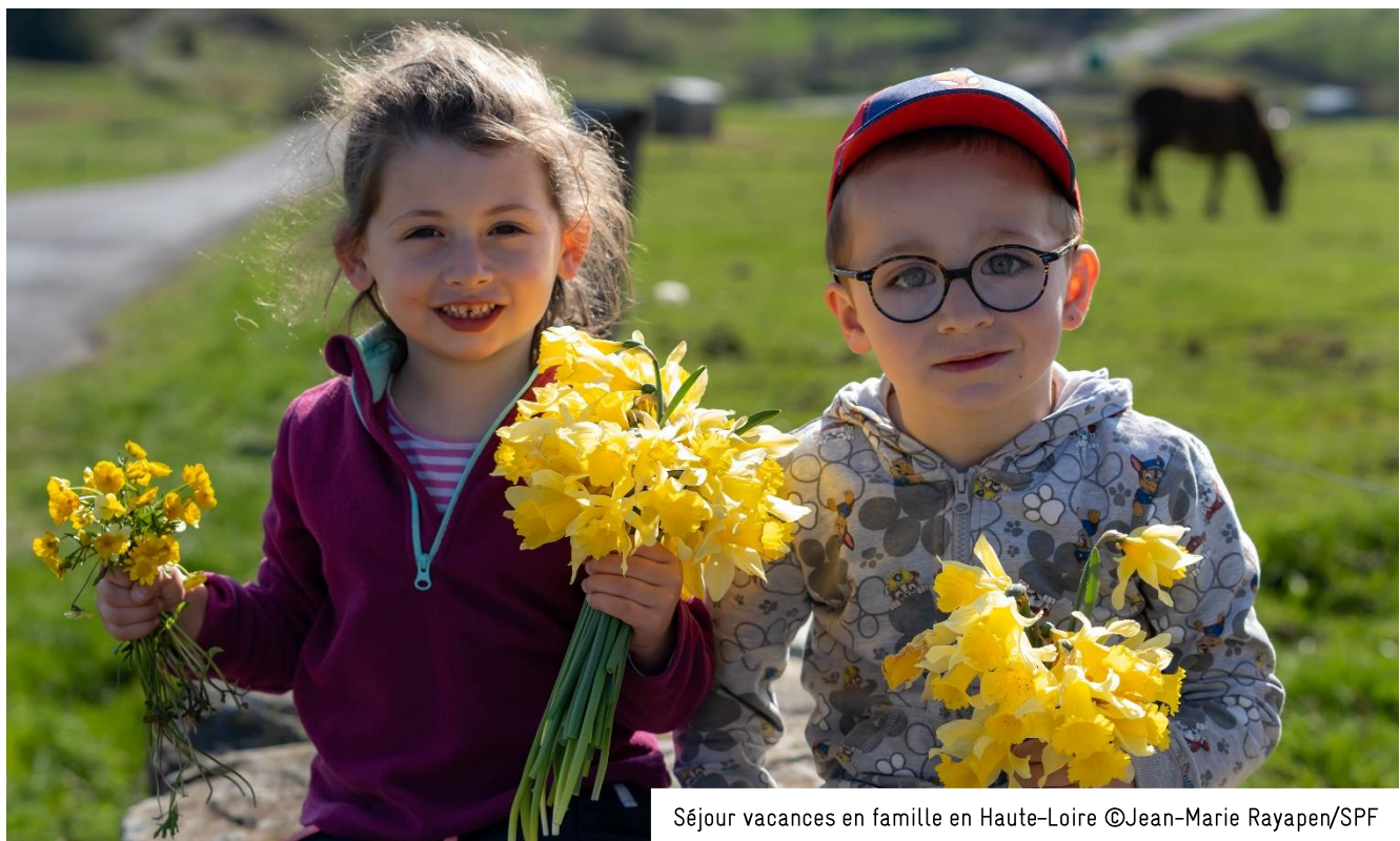
Séjour vacances en famille en Haute-Loire

L'association fait appel à tous les gens de cœur. A titre d'exemple, un don de 50€, soit 12,50€ après réduction d'impôt, offre une « journée de vacances » à un enfant. Les personnes désirant soutenir les initiatives du Secours populaire peuvent devenir bénévoles ou adresser un don financier au comité ou à la fédération la plus proche : www.secourspopulaire.fr