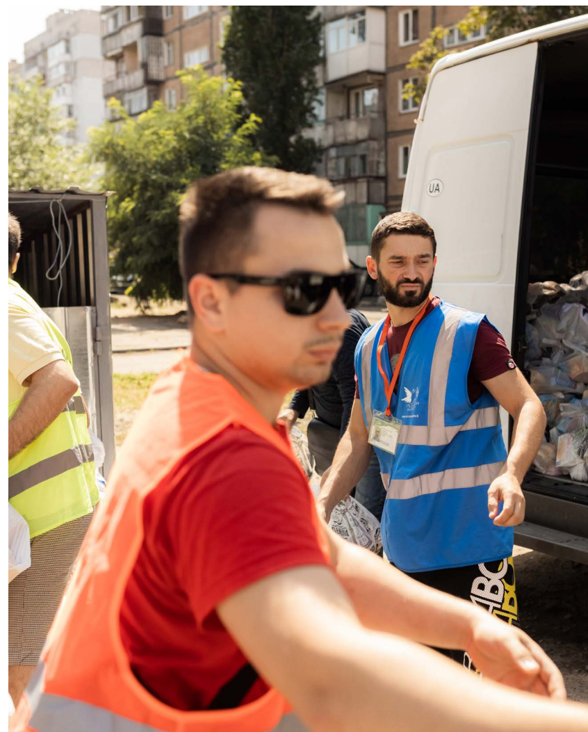
Les distributions de biens de première nécessité ^ à Odessa.