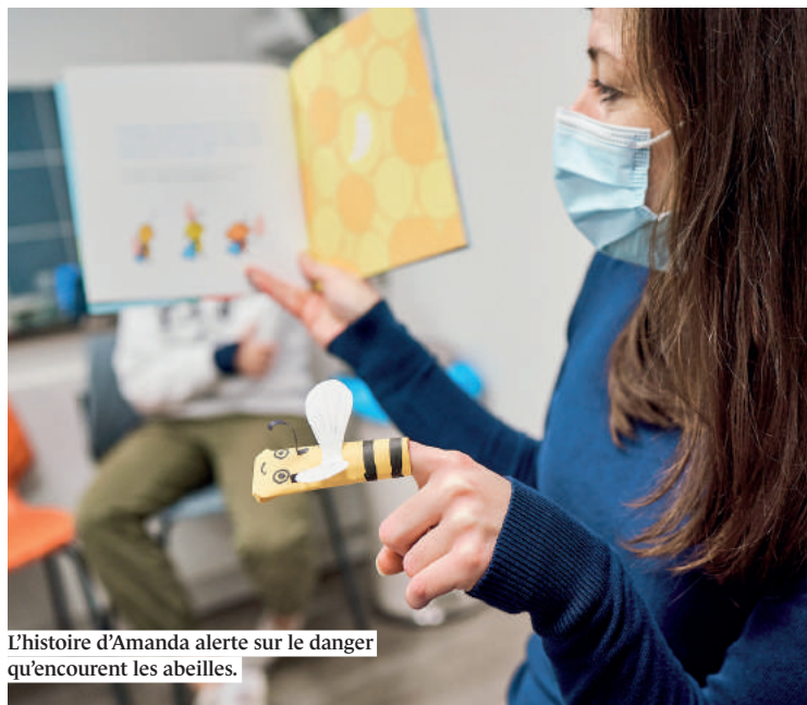
L'histoire d'Amanda alerte sur le danger qu'encourent les abeilles.