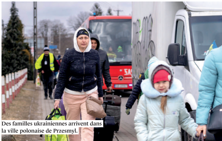
Des familles ukrainiennes arrivent dans la ville polonaise de Przesmyl.