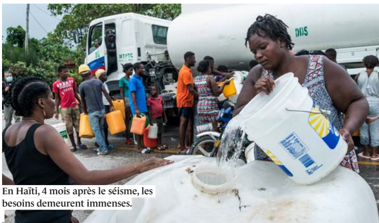
En Haïti, 4 mois après le séisme, les besoins demeurent immenses.