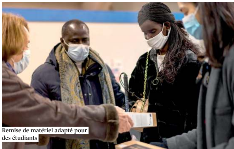
Remise de matériel adapté pour des étudiants