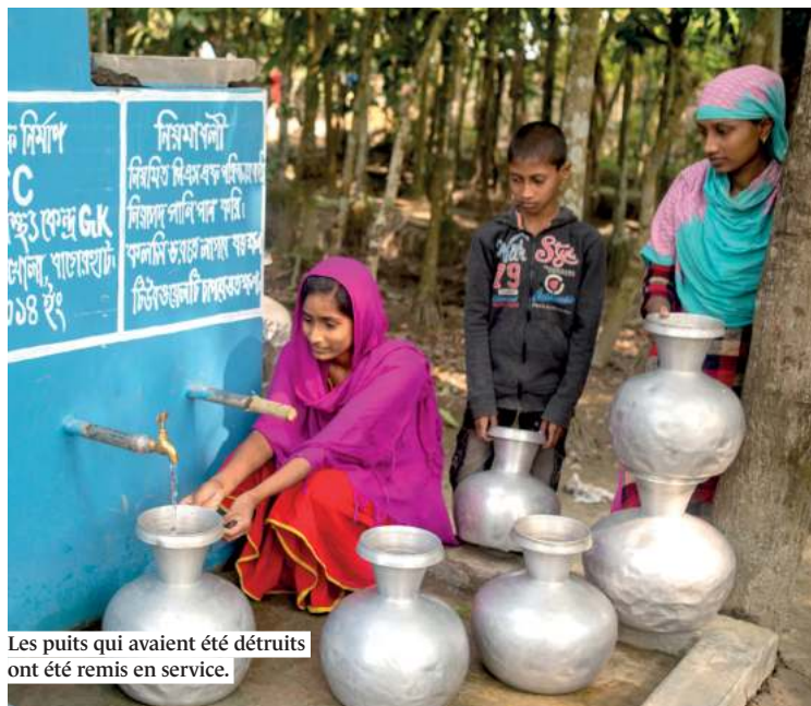
Les puits qui avaient été détruits ont été remis en service.