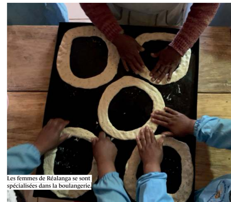
Les femmes de Réalanga se sont spécialisées dans la boulangerie.