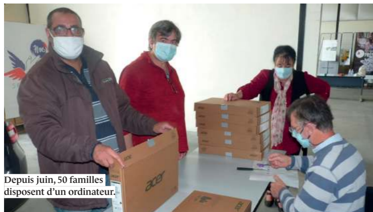
Depuis juin, 50 familles disposent d'un ordinateur.