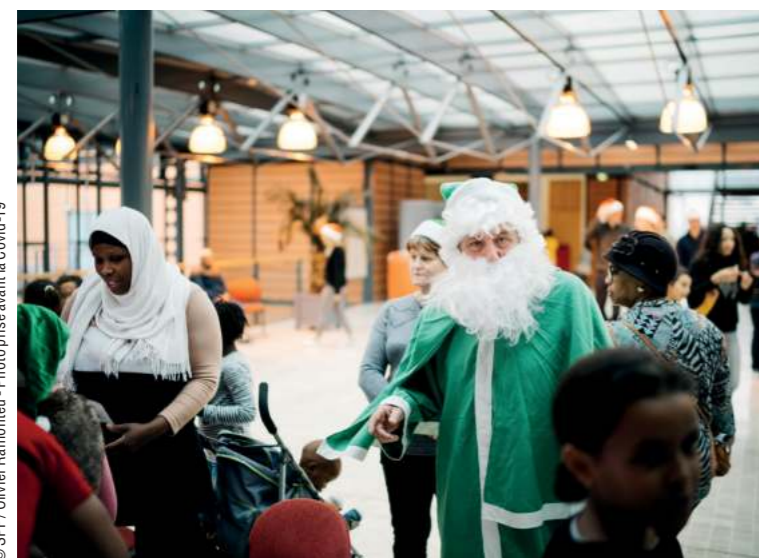
Photo prise avant la Covid-19