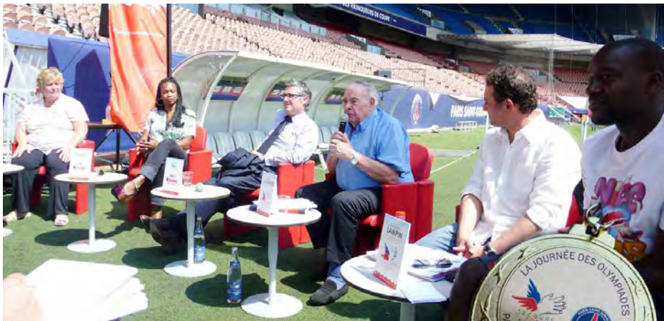
Conférence de presse en compagnie des partenaires et des personnalités sportives