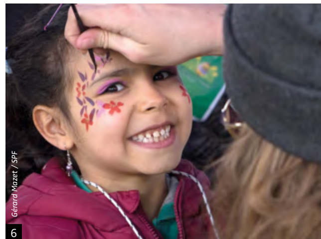
Gérard Mazet / SPF