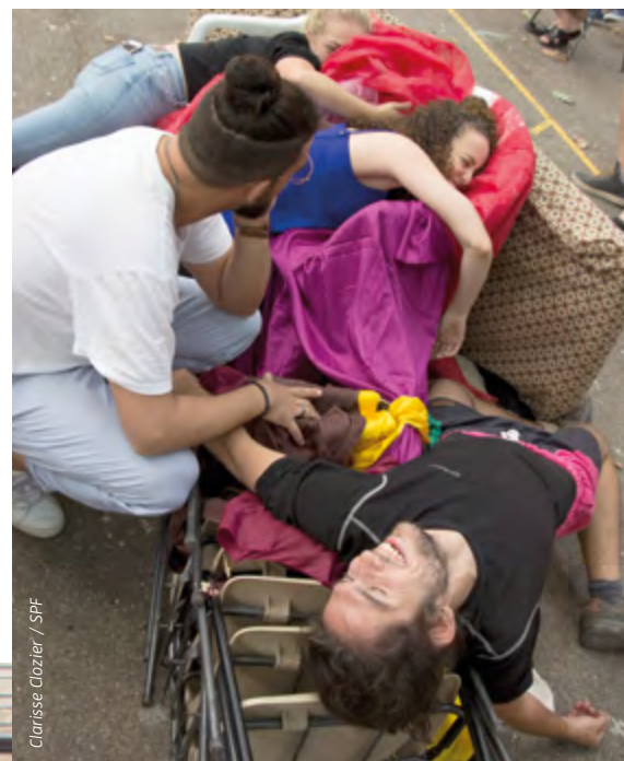
Clarisse Clozier / SPF

Avec les Centres d'entraînement aux méthodes d'éducation active (Ceméa), 78 jeunes venus de 12 fédérations ont séjourné au cœur du Festival d'Avignon en juillet 2017. « Très éloignés de la culture, les jeunes que j'ai suivis n'avaient jamais été au théâtre. Nous avons assisté ensemble à des