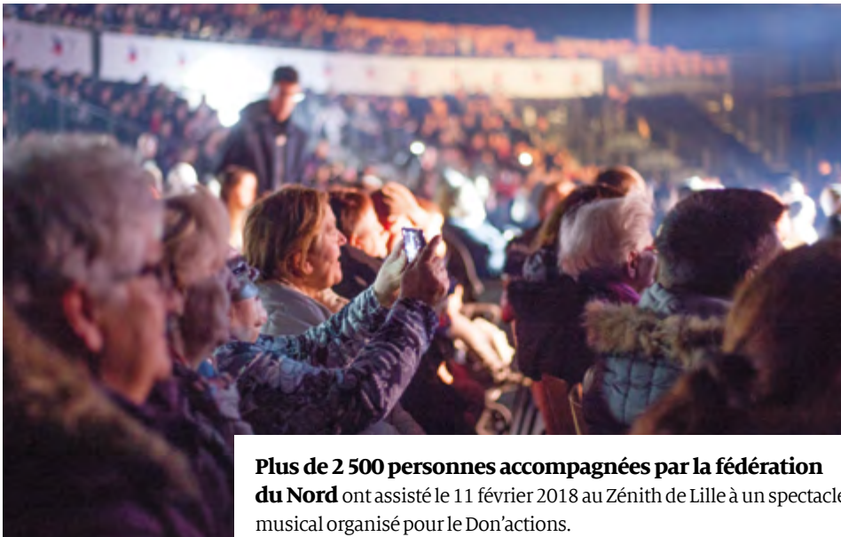
Plus de 2 500 personnes accompagnées par la fédération du Nord ont assisté le 11 février 2018 au Zénith de Lille à un spectacle musical organisé pour le Don'actions.