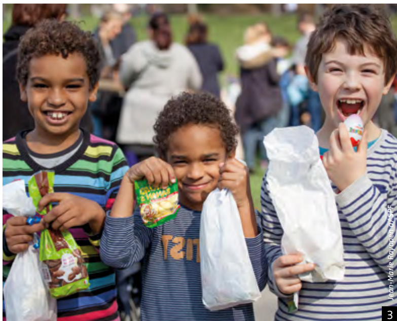
Jean-Marie Royapen / SPF