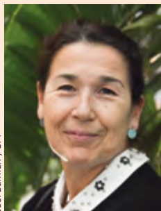
Joël Luminien / SPF

« L'action culturelle menée au Secours populaire transforme aussi le Secours. Toutes ces personnes accueillies qui se métamorphosent, s'enrichissent, s'engagent comme bénévoles, le font évoluer. Cela fait marcher d'un même pas dans le réel. »