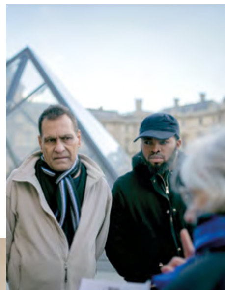
Céline Scaringi / SPF

visité le Louvre. Pendant les activités culturelles, des liens se créent entre bénévoles et personnes accueillies, au point qu'il est impossible de les distinguer. Pour certaines, c'est une occasion de briser l'isolement, dont elles sont victimes comme plus de 5 millions de Français, une situation qui touche davantage les bas revenus, surtout les chômeurs, les inactifs non étudiants, des personnes au foyer pour l'essentiel (5). En cela, ces pratiques culturelles continuent de creuser le sillon de l'éducation populaire, qui, brassant les générations et les cultures, constitue « un véritable laboratoire du vivre-ensemble », selon Jean-Michel Leterrier, dont les