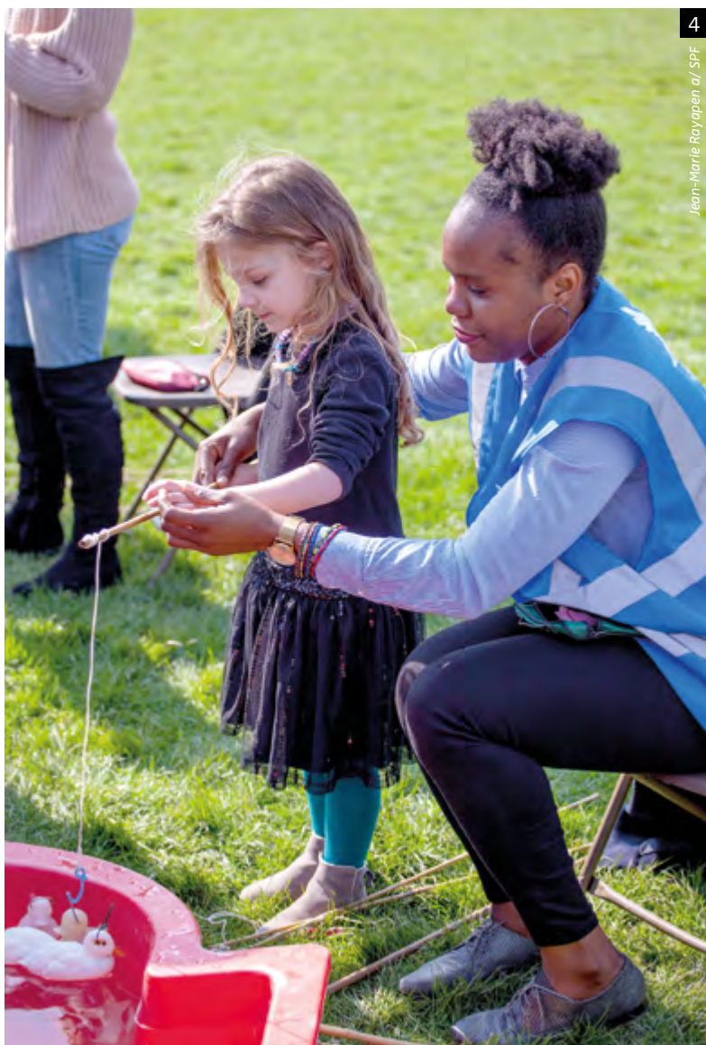
Jean-Marie Royapen / SPF