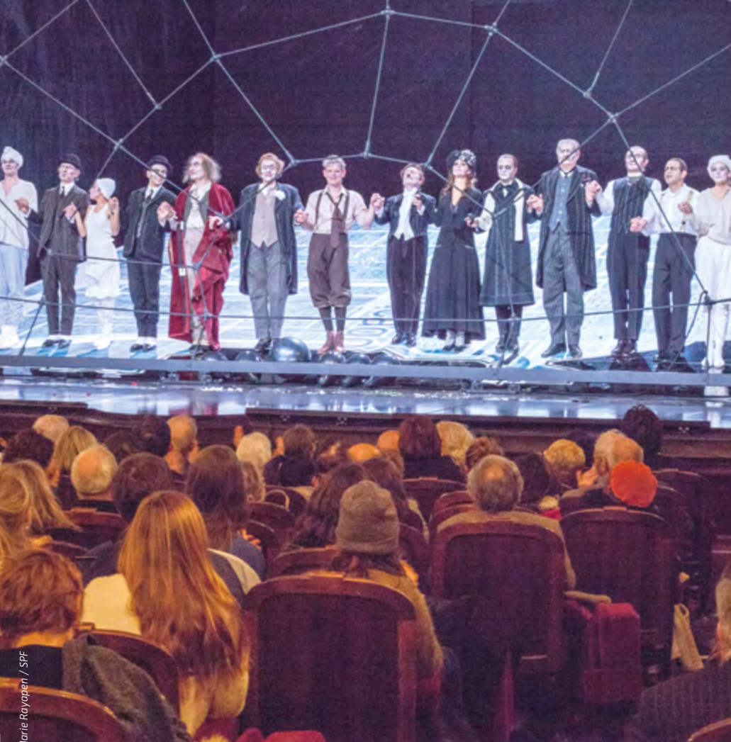
Une première au théâtre et une découverte de la salle Richelieu, pour le groupe de La Courneuve, qui a assisté jeudi 1 er mars à La Résistible Ascension d'Arturo Ui , la pièce de Bertolt Brecht, à la Comédie-Française.