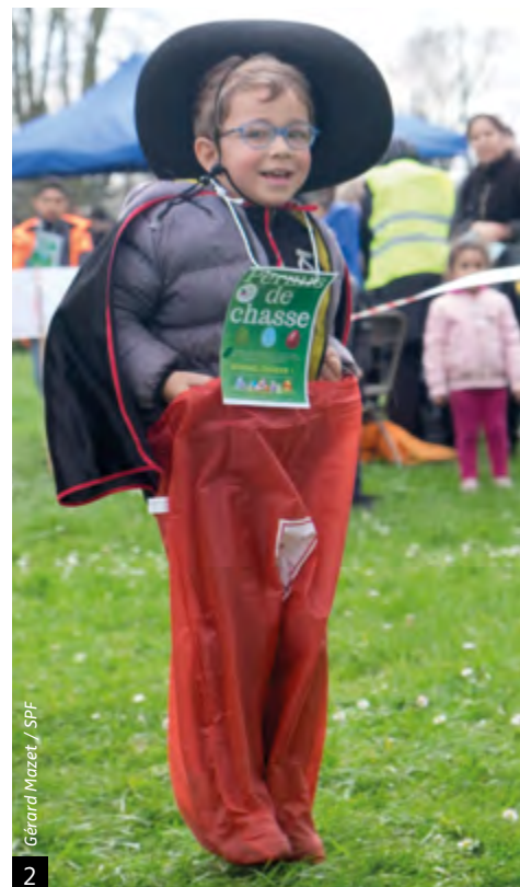
G erard Mazet / SPF 2

Seuls, en bande ou avec leurs parents, les enfants ont participé à 350 chasses aux œufs dans toute la France pendant la période de Pâques. L'argent récolté lors de ces journées financera les actions internationales du Secours populaire, qui a lancé le 21 mars sa campagne Printemps de la solidarité mondiale. À Reims, où 150 bénévoles ont caché 6 000 œufs, les fonds recueillis permettront de bâtir une école au Rwanda et de reconstruire en Haïti des maisons dévastées par les ouragans.