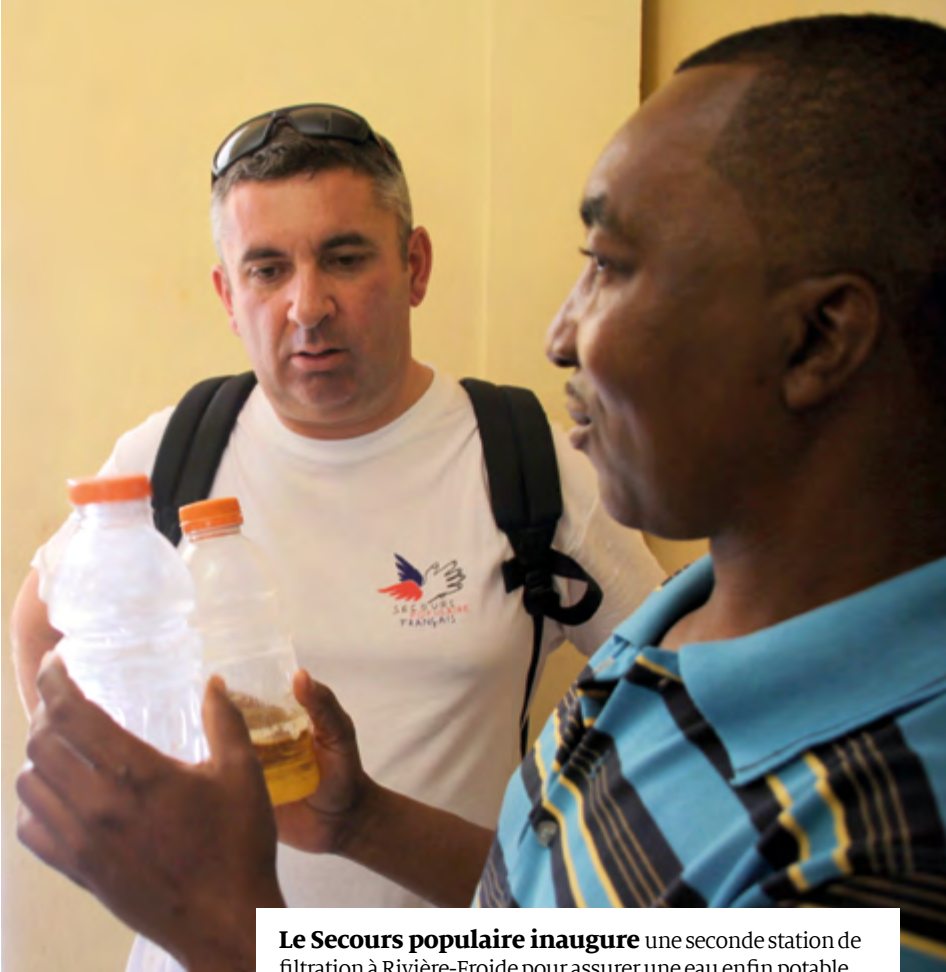
Le Secours populaire inaugure une seconde station de filtration à Rivière-Froide pour assurer une eau enfin potable.