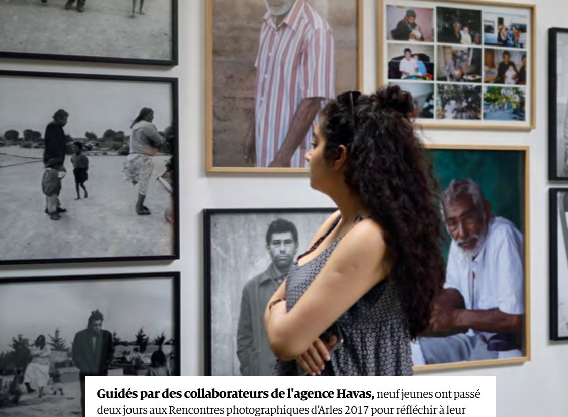
Charlène Rolée / SPF

Guidés par des collaborateurs de l'agence Havas , neuf jeunes ont passé deux jours aux Rencontres photographiques d'Arles 2017 pour réfléchir à leur projet d'exposition sur le thème "Quand on ne part pas en vacances".