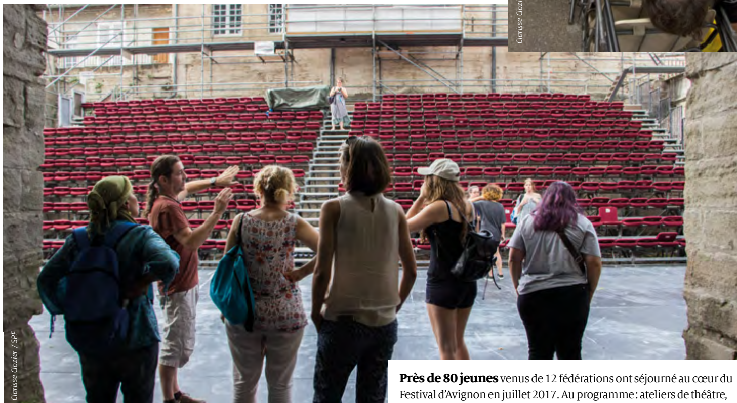
Clarisse Clozier / SPF

Près de 80 jeunes venus de 12 fédérations ont séjourné au cœur du Festival d'Avignon en juillet 2017. Au programme : ateliers de théâtre, découverte de spectacles et de la Cité des papes.