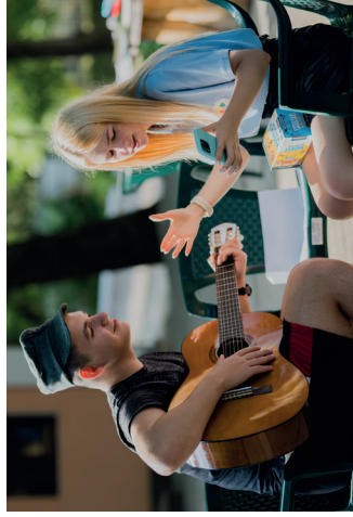
CHISINĂU Du 1 er au 10 août, 47 enfants déplacés ukrainiens et 40 enfants moldaves ont participé au premier village Copain du Monde organisé dans le pays.