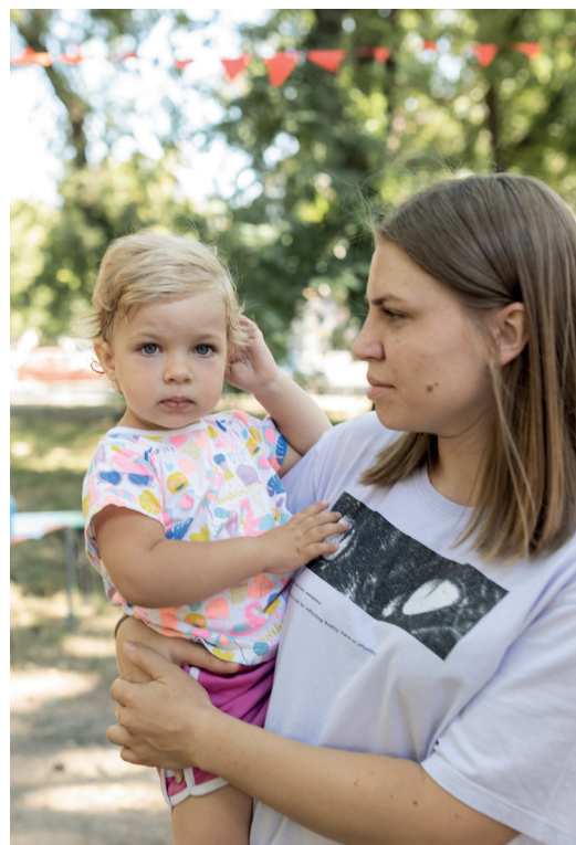
Une « journée bonheur », une bouffée d'oxygène pour ces enfants qui grandissent dans un contexte de violence et de peur.

Une centaine de bénévoles ukrainiens est pour cela mobilisée avec l'appui d'un réseau associatif local très actif. Cette aide essentielle pour des populations très isolées s'accompagne d'un soutien moral important lors de ces distributions conçues comme des moments conviviaux : repas ou collations offerts, temps d'échanges... Dans cet esprit, en juillet 2022, UAS Four-leaf clover a élargi son soutien en proposant une « journée