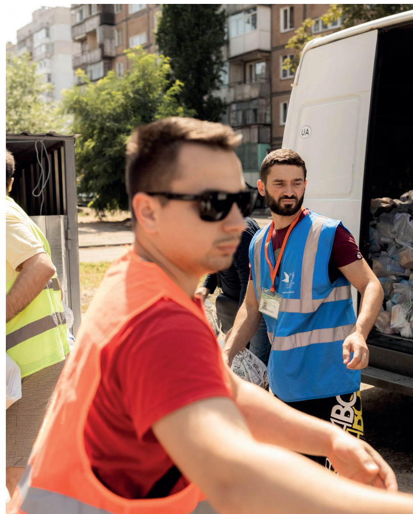
Les distributions de biens de première nécessité se poursuivent à Odessa. ^