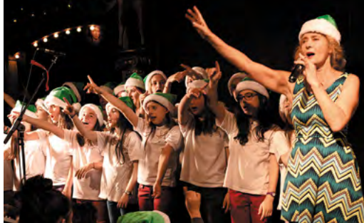
Lancement de la campagne des Pères Noël verts de 2016 au Musée des arts forains (Paris).

Sur le terrain, les initiatives et les formes de collecte s'organisent pour offrir ces moments festifs aux personnes aidées : des opérations « paquets-cadeaux » et « tirelires » dans la grande distribution et les commerces, des parades de Pères Noël verts, des soirées de gala, des ventes aux enchères et des marchés de Noël solidaires.