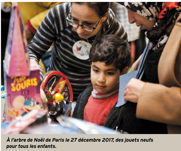
À l'arbre de Noël de Paris le 27 décembre 2017, des jouets neufs pour tous les enfants.