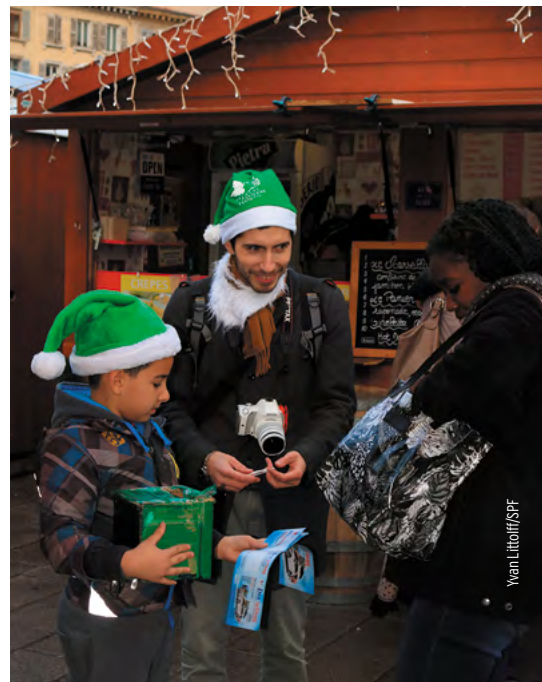
Parade des Pères Noël verts à Marseille en 2017.