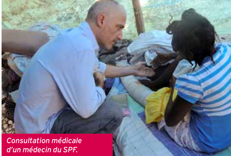
Consultation médicale d'un médecin du SPF.

BÉNÉFICIAIRES DIRECTS : 39 349 personnes LIEUX : Carrefour (Rivière-Froide), Delatte, Grande-Anse, Jacmel, Leogâne, Les Palmes, Petit-Goâve, Port-au-Prince. PARTENAIRES : Aidons les Enfants d'Haïti, Concert-Action, CCAS (Centre communal d'action sociale), CPFST (Congrégation des Petits Frères de Sainte-Thérèse) Prodeva. STRUCTURES SPF PILOTES : Association nationale, Fédération du Nord, Fédération nationale des Électriciens Gaziers. TERMINÉ