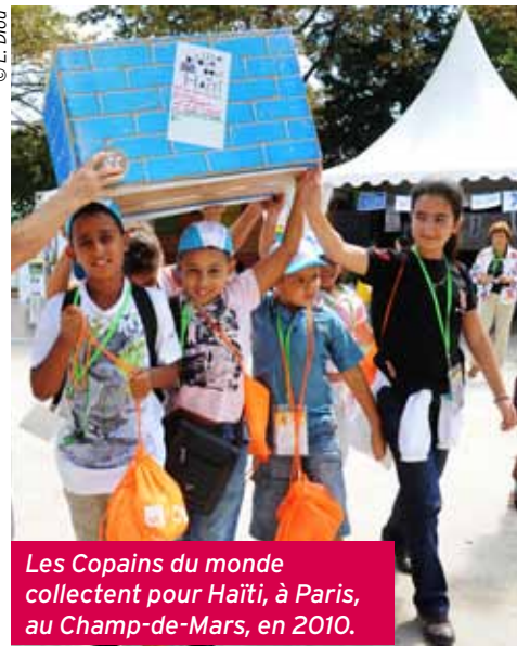
Les Copains du monde collectent pour Haïti, à Paris, au Champ-de-Mars, en 2010.

Supplément à Convergence n° 321 - 9-11 rue Froissart 75140 Paris Cedex 03 - Tél.: 01 44 78 21 00 - Commission paritaire n° 0214H84415. Issn 0293 3292. Impression: Presses de Bretagne - Photogravure: Panchro - Maquette: Hélène Laforêt-Thibault / JBA. Ce numéro a été tiré à 267 000 exemplaires. Dépôt légal: janvier 2012. Directeur de la publication: Robert Olivier. Ont participé à ce numéro: Stéphanie Prouvost, Camille Guérin, Marine Samson, Corinne Makowski, Audrey Champsiaux, Jean-Pierre Delétréz, Régine Riva (révision), Olivier Vilain. Merci à toutes les personnes du Secours populaire qui nous ont aidés à préparer ce numéro.