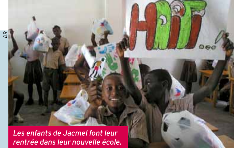
Les enfants de Jacmel font leur rentrée dans leur nouvelle école.

BÉNÉFICIAIRES DIRECTS : 1 280 élèves. LIEU : Léogâne (région de Port-au-Prince). PARTENAIRE : Association France-Haïti de solidarité et d'amitié. AUTRE SOUTIEN : Mairie de Vitry-sur-Seine. STRUCTURE SPF PILOTE : Comité du Livre. À L'ÉTUDE