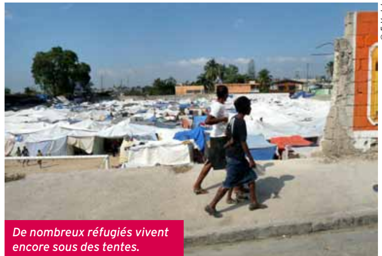
De nombreux réfugiés vivent encore sous des tentes.

À 80 kilomètres au sud de Port-au-Prince, la ville de Jacmel vit aussi dans l'urgence lorsque les équipes du Secours populaire du Limousin arrivent. Les Pompiers de l'Urgence internationale y ont installé un dispensaire de campagne avec le soutien de l'association et assurent plus de 1 000 consultations médicales. Quelques mois plus tard, un programme scolaire et un soutien agricole sont sur pied. Les premiers résultats furent rapides. Il reste encore beaucoup à faire. ■