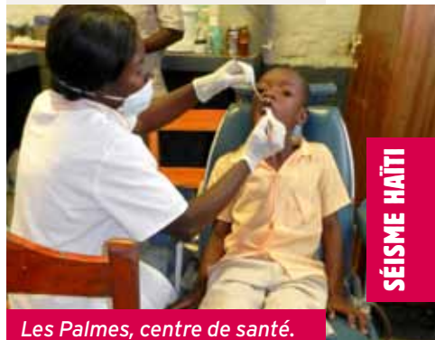
Les Palmes, centre de santé.