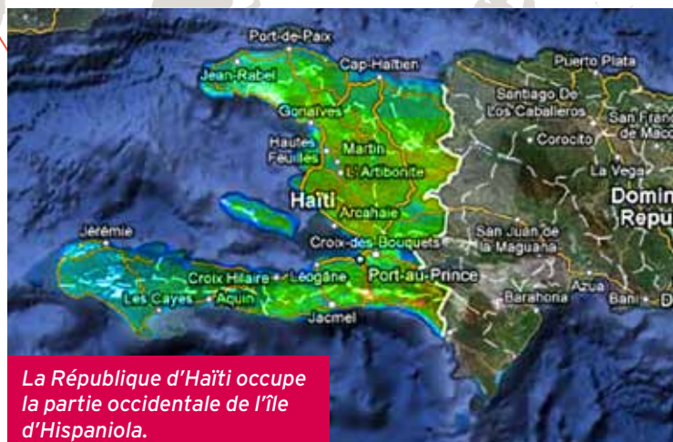
La République d'Haïti occupe la partie occidentale de l'île d'Hispaniola.