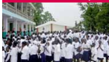
L'école de Carrefour inaugurée.