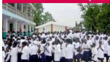
L'école de Carrefour inaugurée.