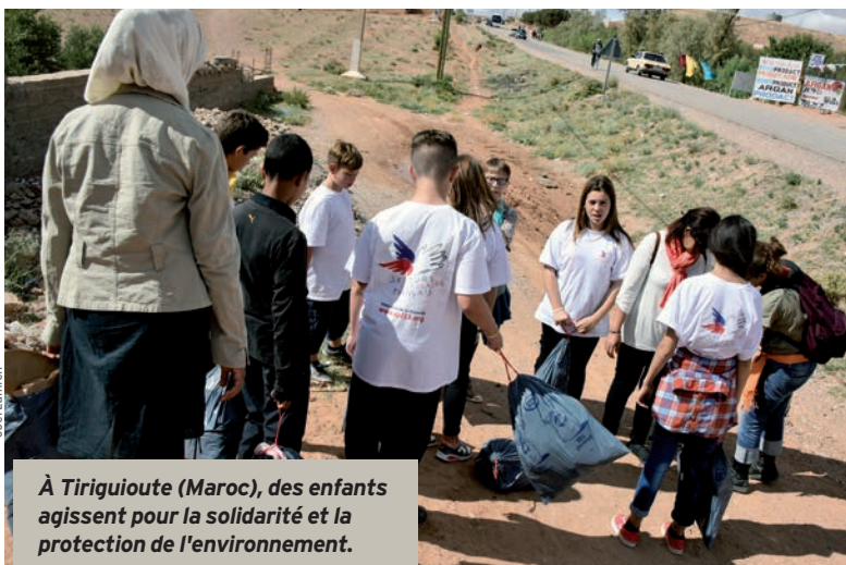
À Tiriquioute (Maroc), des enfants agissent pour la solidarité et la protection de l'environnement.