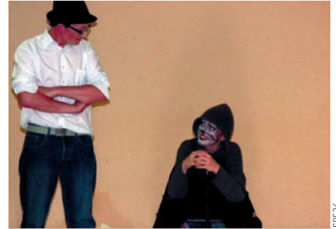
Des enfants de La Châtre au cours de théâtre du mercredi.

■ Pour en savoir plus : comité de la Châtre au 02 54 48 16 01